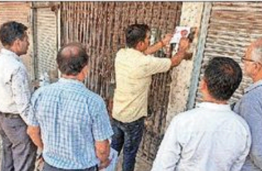
विना बोसोस पकें को सील किया। इसके बाद एक के बाद एक लेकर कोर्ट हॉस्पिटल, पीएमबी, आईटीआई, शांति विलास मंदिर, चरणम हॉस्पिटल सील करने 44 निर्माणों पर सील लगा दी। आवास विकास को कार्रवाई के चलते व्यवहारियों में हड़कण मच गया। सेंट्रल मार्केट में मंडावरी व्यवारी सीलिंग के दौरान आवास विकास की टीम का विरोध करते हुए सड़क पर बैठ गए। जिनमें पुलिस ने समझा कर हटाया।