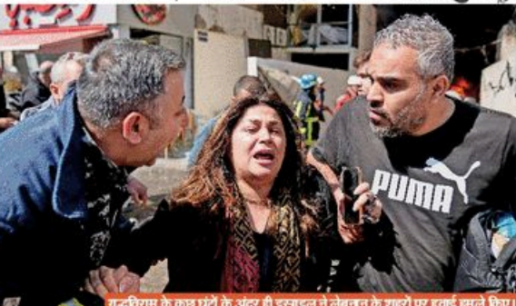
युद्धविराम के कुछ घंटों के अंदर ही इराक ने लेबरन के शहरों पर हवाई हमले किए।

■ एपी, वाशिंगटन/तेहरान: इस जल सच बेचने के साथ संघ में, कोई अलमल बनकर ले कोई लन-बन न्यून अरबेट देखकर, लेकिन सुबह हुई के उम्मीद की किरा भी नगर आ रहे। मजबूत को मिला देने वाली धमकी में विश्व आगे बढ़ गया और युद्ध की असमंजस पर विचार लगने पर सहमति बन गई, शुरूआत भले हो तो हमने के पीछे से हुई है। पश्चिम एशिया में 28 फरवरी से शुरू हुई लंग में 3700 से ज्यादा मौतों के बाद 40वीं दिन चल रही खबर आई। अमेरिका और ईरान दो हफ्तों के सीजफायर पर सहमत हो गए। पाकिस्तान की मध्यस्थता और अंडरली समझ में चीन के दखल के बाद यह संभव हो पाया। होर्मुज समुद्री मार्गका खोलने और चीन के लिए ईरान पर टूट की डेटालाइन मजबूत संभव के मुताबिक बुधवार सुबह 5:30 बने खबर हो रही थी। इससे ठीक 10 मिनट पहले ही पाकिस्तान के प्रधानमंत्री इमरान खान ने ऐलान किया कि सीजफायर शुरू कर दिया है। फिर टूट में ऐलान किया कि इराक और फिलिप मार्शल मुनीर से बातचीत के बाद अमेरिका सीजफायर को रोकने हुआ है। ईरान ने भी मंजूरी देते हुए कहा कि हमारी शर्तें मान ली गई हैं। पाकिस्तान ने जिम्मेदारता सीजफायर का ऐलान किया, उसमें लेबरन में भी हमने देखने थे, लेकिन इराक ने कहा हमने नहीं रखा। इससे पता चलता है कि ईरान को फिर बंद कर दिया और कहा कि हमने होने रहे से खबरदार तोड़ दी। पेज 5