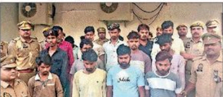
साइबर अपराधियों को पकड़ने को पुलिस ने खेतों की मदद ली, हर व्यक्ति रोज 1 लाख कमाता था।

NBT रिपोर्ट, कानपुर: कानपुर पुलिस ने रेडन भागेश्वर के वडोवा में मल्लार शम बड़ी कर्माई करके 20 साइबर ठगों को गिरफ्तार किया। पुलिस बसिन्स स्टूडेंट्स लाने बुधवार को कानपुर-नौलगा आराम रेकोर्ड व्यूरो के प्रतियोगिता में इस ठगों को खबर अग्रवध के लिए हॉटलिट्ट मंगल रात है। पुलिस को कुछ ठगों ने शिकायतें मिल रही थीं कि रेडन भागेश्वर के गाँव में कई युवक मंगल रात में मिला बंद-बंदकर साइबर प्रोफाइल कर रहे हैं। नूरुलमावी शम पुलिस ने वडोवा वल के पास रैकी के बंद ठग में। यहां ठगों और ठगों के गिने बड़ी संख्या में युवक मौजूद। पर कुछ करते दिखे। जिसके बाद पूरे ठगों को पकड़ कर रखा गया था। इस दिन 17 आरोपी मौके से पकड़े गए। पुलिस के अनुसार, यह ठगों बैठकर और नूरुलमावी के जरूर लोगों को निराल बनाता था। आरोपी ठग को सक्की कर्माई बतकर कैंस करके और प्रमाणों के आधार योजना में चला कर इलाक देते थे। रविदेवत के नाम पर 1100 रुपये वसूले जाते थे। कुछ मामलों में ठगों को ठगने के लिए अत्यंत विविध तरीकों का उपयोग करके पुलिस पकड़ कर घर दिखाना जाता था। हर आरोपी रोज 100 से ज्यादा कैंस करता था, जिसमें कुछ सखी करते में आ जाते थे। इससे हर व्यक्ति रोज करीब 1 से 1.5 लाख रुपये कमा लेता था।