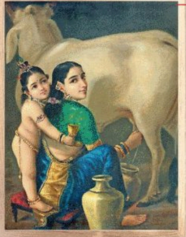
राज रवि वर्मा की मशहूर कलाकृति 'कृष्ण वरोडा' जो हाल ही में 1.67 cr की बिक्री

हाल ही में राज रवि वर्मा की बेहतरीन रचना 'कृष्ण-वरोडा' का $167 करोड़ में विक्रम न केवल कला जगत में चर्चा का विषय बना, बल्कि इसने एक बार फिर उस बहस को छेड़ दिया है—अद्वितीय कला के अर्थ और मूल्य के बीच की खाई। यह एक कलाकार के कर्म के प्रति और ऐतिहासिक कला के प्रति सम्मान का प्रतीक है, लेकिन आम आदमी को यह महत्व 'एन और केनसिस' का टैगल लगता है। सचमुच यह है कि कला की कीमत केवल उसकी सुन्दरता में नहीं, बल्कि उसके पीछे छिपी विरासत, ज्ञान और बाजार के अर्थशास्त्र में होती है।