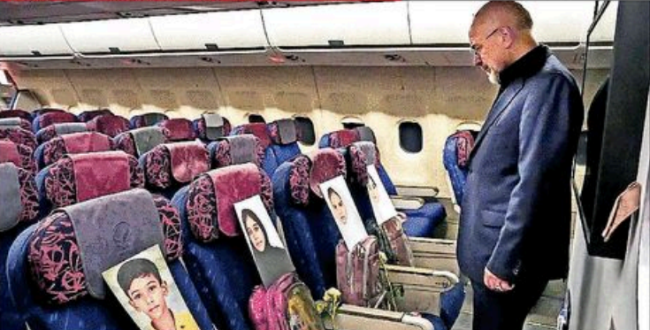
ईरान की संसद के रवीकर मोहम्मद वाकर गालीबाफ विरा प्लेन से इस्लामाबाद पहुंचे, उससे मिनाब के रजुल पर हमले में गायी हुई बगियरों की फोटो और वीडियो

दोप में कल, पाकिस्तान के हवाई कारवाही के फेल हुईं तो सेना तैयार है।