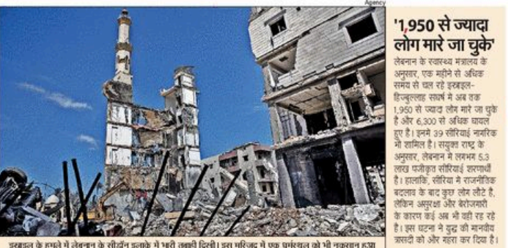
इस्राइल के हमले में लेबनान के सौतेला हलके में गरी उखाड़ी दिल्ली। इस गरीबद में एक फॉर्नवर्क को भी नुकसान हुआ

इराकली सेना ने शनिवार को कहा कि उसने पिछले 24 घंटों में लेबनान में हिज्बुल्लाह के 200 से ज्यादा ठिकानों पर हमले किए, जिसमें सैकड़ों लोगों की मौत हुई।