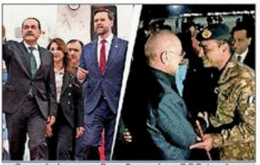
पाकिस्तान के सेना प्रमुख अरिफ मुनीर US-ईरान प्रतिनिधिमंडल के साथ

इस्लामाबाद में अमेरिका और ईरान के बीच अग्रिम बातचीत के दौरान वार्ता कूटनीतिक मुद्दों पर चर्चा होगी, जहां अग्रिम पाकिस्तान का इंतजाम पाकर चर्चा का केंद्र बन गया।