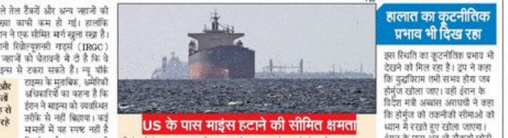
US के पास माइंस हटाने की सीमित क्षमता

ईरान और अमेरिकी के बीच दो हफ्तों के सैनिकीय चर्चा के बाद ईरान ने होर्मुज़ स्ट्रेट में माइंस लगाकर भूल गया है।