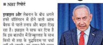
इराकली पीएम नेपाण्डित नेपाण्डित

इराकली और लेबनान के बीच अग्रिम हलके वार्ता के दौरान अग्रिम बैठक से पहले दोनों बंद हो गए।