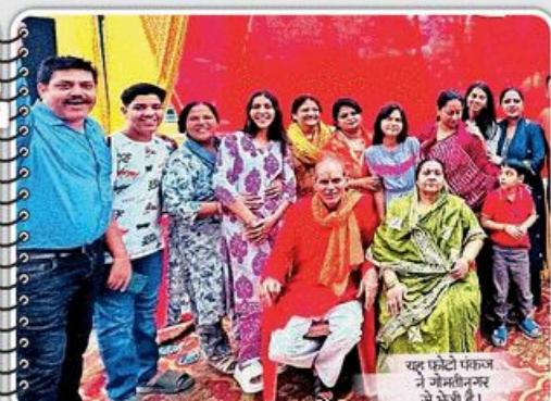
यह फोटो फीचर में जैमलीनगर से भेजी है।

अपनी मस्ती भरी तस्वीरें हमें lucknowtimes.nbt@gmail.com पर भेजिए। मेल में अपना पता व नंबर जरूर लिखें और सम्बन्ध में लिखें- kichhoge to Dikhoge