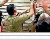
गोरखपुर में नाबालिग की गर्दन शटर में फंसी।

NBT रिपोर्ट, गोरखपुर: क्लिनिक में चोरी के इरादे से घुसे नाबालिग की गर्दन शटर में फंसी।