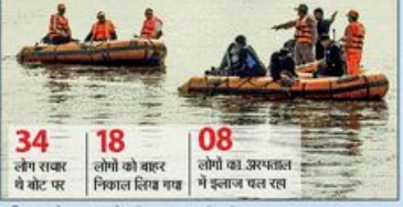
34 लोग राबकर थे बोट पर, 18 लोगों को बचर निकाल लिया गय, 08 लोगों का अस्पताल में इलाज चल रहल।

NBT न्यूज, मथुरा: मथुरा नदी में मोटरबोट हादसे में मरने वाले 11 हुए, 5 अब भी लापता।