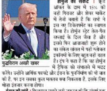
होर्मुज का संकट । क्रूड ऑयल के दाम में 15% की बढ़ी गिरावट और शेयर मार्केट में तेजी रुकती है कि रूस ने इस नए डिलेवरीमेंट का स्वागत किया है। होर्मुज स्ट्रेट तेल-गैस सप्लाई के दिल जैसा है और इससे फिर आबाजाही शुरू होने का संकेत संकेत में पढ़ी गलेकट डेवेलपमेंट के लिए बहुत बड़ी गारंटी है। 2019 में कहा है कि यह होर्मुज में ट्रेडिंग को संकलने में मदद करेगा। उन्होंने आर्थिक फायदे और इंग्लैंड के पुनर्निर्माण की भी बात की है, पर इन सवाल कुल मिलाकर क्या निकलते हैं, इसके लिए थोड़ा इंतजार करना होगा।

अमेरिका और इंग्लैंड 40 दिन चले लंबे संघर्ष के बाद आखिरकार सीनो-रूस पर राजी हो गए। संसारव्यापक बात यह है कि इसाइल ने भी इस पर सहमति दी है। और चुनौती यह कि शांति अभी अस्थायी है। दोनों पक्षों को मिलकर एक स्थायी समझौते तक पहुंचना होगा। ये हत्यारे का सीनो-रूस । पश्चिम एशिया की जनजाति अक्सर ऐसे लंबे मोड़ लेती है, जिसका अंतर पूरी दुनिया पर पड़ता है। इस लड़ाई की शुरुआत भी ऐसी ही थी और संघर्षविरम का फैसला भी। डॉमिनिक ट्रांश की डेवेलपमेंट खत्म होने से पूरा पड़ते दो हफ्ते के संकटकाल पर सहमति बनी और फिलिस्तीन ने इसमें माध्यम की भूमिका निभाई।