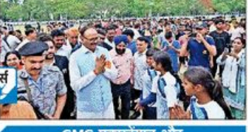
CMS एक्सटेंशन और गोल्फ सिटी सेमीफाइनल में