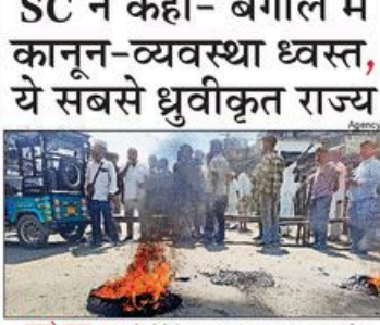
हाइवे जाम मालदा में लोगों ने टाकर जलाकर सड़क जाम कर दी।