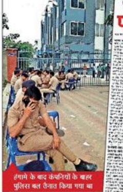
हंगामे के बाद कंपनियों के बाहर पुलिस बल तैनात किया गया था

NBT रिपोर्ट, गुड़गांव आठवां (इंटरनेट) मनेसर में 9 अप्रैल को हुए घटनाओं की जांच के दौरान पुलिस ने साजिश की रची थी। एक वॉट्सऐप ग्रुप में भड़काऊ चैट की जा रही थी।