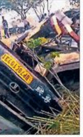
घायलों को एम्बुस करीब 20 बरतियों के लेकर निकाला गया। घायलों को एम्बुस करीब 20 बरतियों के लेकर निकाला गया।

मध्यमत्री योगी ने जताया शोक, डीएम और एसपी ने घायलों का हालता जाना मध्यमत्री योगी ने जताया शोक, डीएम और एसपी ने घायलों का हालता जाना। मध्यमत्री योगी ने जताया शोक, डीएम और एसपी ने घायलों का हालता जाना।