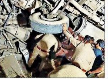
घोलाणा-मसुरी रोड पर हुआ हादसा, सूचना मिलते ही मौके पर पहुंचे पुलिसकर्मी। घटना का दृश्य

■ NBT रिपोर्ट, गुड़गांव, पश्चिम/एम्बुस पश्चिम क्षेत्र में सोमवार अज्ञात घुसक बसों की भीड़ का कारण बसों में भीड़ बढ़ गई। बसों में भीड़ बढ़ने से बसों और कैटर की टक्कर का कारण 6 बरतियों की मौत हो गई। जिनमें 3 लोग घायल हो गए। घायलों में तीन की हालत नाजुक है। घटना की सूचना मिलने पर मौक पर एम्बुस अधिकारियों और एम्बुस कृपण शांतनाथ सिंह ने राहत कार्य का आरंभ किया। बसों और डॉक्टरों को बेतक इलाज देने के निर्देश दिए। घायलों को एम्बुस करीब 20 बरतियों के लेकर निकाला गया। घायलों को एम्बुस करीब 20 बरतियों के लेकर निकाला गया। घायलों को एम्बुस करीब 20 बरतियों के लेकर निकाला गया।