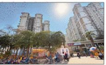
पेटर फरीदाबाद की विरोस पार्क सोसायटी में बुधवार सुबह हुआ हादसा

पेटर फरीदाबाद सेक्टर-56 फिना प्रिटीम पार्क सोसायटी में बुधवार सुबह 70 वर्षीय एक बुजुर्ग लिफ्ट में फंसा था। सोसायटी में ठंडा ठंडा की वजह से लिफ्ट में फंसा बुजुर्ग 5:55 बजे बुजुर्ग केमेट 1 में जाकर फंसा गुरु निराले के वाकी पर गए। इलाज में बदन खजने लगे। लीफ्ट में फंसा बुजुर्ग ने सोसायटी के वॉलस्टेपेन ग्रुप पर मेसेज डालकर लीफ्ट को सुविधा किया, लेकिन मदद नहीं मिली। करीब 6:10 तक लिफ्ट में ही फंसे रहे, जिसके बाद गार्ड ने उन्हीं बहार निकाला। सोसायटी में चार हजार से अधिक लोग रहते हैं। इस हादसे में सोसायटी में लिफ्ट को पंचन के बाद से लीफ्ट में दुर्घटना का मसौदा है। लीफ्ट का पंचन है कि लिफ्ट में फंसे बुजुर्ग ने बंद बंद बन्दको बंदन दबाया, लेकिन इसके बादबुद्ध कोई मदद नहीं पहुंची। लिफ्ट में लगे इमरजेंसी और माइक के जरिए भी उन्होंने सहायक के लिए आवाज लगाई, लेकिन शुरूआती समय में कोई प्रतिक्रिया नहीं मिली। करीब 15 से 20 मिनट तक बुजुर्ग लिफ्ट में फंसे रहे, जिससे उनकी पचकन बढ़ गई। बुजुर्ग लखनऊ पचकन बटन दबाते रहे और और-और से मदद के लिए पुकारते रहे। वाकी देर