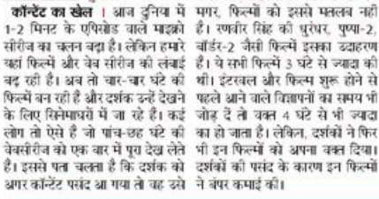
शो की संख्या घटी

कॉमन रूम । आज दुनिया में 1-2 मिनेट के एपिसोड वाले माइक्रो सीरीज का चलन बढ़ा है। लेकिन हमारे यहां फिल्में और वेब सीरीज की लंबाई बढ़ रही है। अब तो चार-चार घंटे की फिल्में बन रही हैं और दर्शक उन्हें देखने के लिए डिवाइसों में जा रहे हैं। अब टीवी सीरीजों में 40-50 एपिसोड वाले धारावाहिकों पर जबर दे रहा है। भारत की फिल्में 3 घंटे से ज्यादा की थीं। इंटरनेट और फिल्म सुट्टी के फलते आने वाले डिवाइसों का समय भी घटने लगे हैं। अब टीवी सीरीजों में 40-50 एपिसोड वाले धारावाहिकों पर जबर दे रहा है।