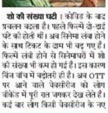
शो की संख्या घटी

शो की संख्या घटी । कोविड के बाद प्रचलन बढ़ता है। पहले फिल्में दो-घाई घंटे की रहती थीं। अब विमना लंब होने की संश्ल प्रकट के दाम भी बढ़ गए हैं। फिल्में लंबी होने से सिनेक्षरों में शो की संख्या भी कम हो गई है। इस कारण विन बाँच में बंदोर्त ही है। अब OTT पर आने वाले वेबसीरीज को लोग वीकेंड में पूरी जन अपनार देख लेते हैं। कई बार लोग किसी वेबसीरीज के नए