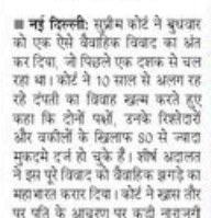
मंदिनेस पर कोई बहाना नहीं चलेगा

■ नई दिल्ली: सुप्रीम कोर्ट ने बुधवार को एक ऐसे वैवाहिक विवाद का अंतिम कर दिया, जो पिछले एक दशक से चल रहा था। कोर्ट ने 10 साल से अलग रह रहे दंपती का विवाह खत्म करते हुए कहा कि दोनों पक्षों, उनके रिश्तेदारों और वकीलों के खिलाफ 80 से ज्यादा मुकदमों दूर हो चुके हैं। सौभाग्यवश नई दिल्ली के वैवाहिक इलाके का महाभारत खत्म हो गया। कोर्ट ने खत्म हो रहे पति के आधार पर कड़ी नजर नहीं लगाई। पक्षों से वकीलों पति पर कोर्ट ने निर्णयों की कि उनसे अपनी बहन-बहनकरों का इलाका मुकदमों को खत्म करने और पत्नी को और से पेश हो रहे वकीलों को खत्म-धमकाने के लिए किया।