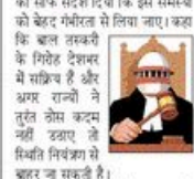
जजों ने दिए अलग-अलग उदाहरण

■ नई दिल्ली : देश में बढ़ती बाल तस्करी के मामले पर सुप्रीम कोर्ट ने बुधवार को गहरी चिंता जताई।