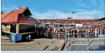
9 जजों की बेच सबरीमला में महिलाओं की एंट्री से जुड़े केस सुनी रही है।