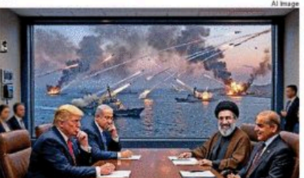
अमेरिकी दबाव को चुनौती

होमूज का सच । इस संयम में होमूज एक बड़ा मुद्दा रहा, पर हकीकत यह है कि वह गहरा तो कभी पूरा तरह नहीं है। ईरान ने केवल अर्ध-ईरान-इराकल और उनके सहयोगियों के जहाजों की आवाजाही पर पकड़ी लगाई थी। अब इस के खुलने को बहुत बड़ी उपलब्धि के तौर पर पेश किया जा रहा है, जो महंगे सैन्य अधिमान के बाद मिली है।