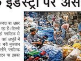
कच्चे माल का रेट बढ़ने से प्लास्टिक इंडस्ट्री पर असर पड़ रहा है।

ग्लोबल इंडस्ट्री में बढ़ते मूल्यों और तनाव का असर बाजार में दिख रहा है। प्लास्टिक इंडस्ट्री पर असर पड़ रहा है। कच्चे माल का रेट बढ़ने से प्लास्टिक इंडस्ट्री पर असर पड़ रहा है। कच्चे माल का रेट बढ़ने से प्लास्टिक इंडस्ट्री पर असर पड़ रहा है।