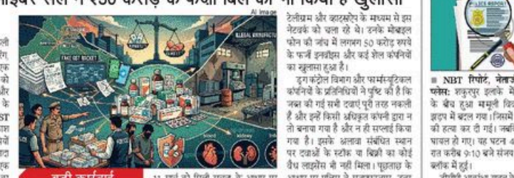
नामी ब्रैड्स के नाम पर बेच रहे थे नकली दवाएं, छह अरेस्ट, ₹2 करोड़ की दवा पकड़ी।