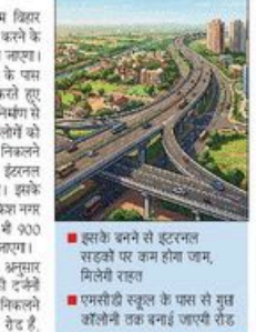
यहां बनाई जाएगी 900 मीटर लंबी रोड

महारौली-बदरपुर रोड से संगम विहार की दूरी को घटाने के लिए 5 किमी लंबा बाईपास बनाया जाएगा। बाईपास एमएचटी प्रवासी सिलिंडर के पास से शुरू होगा और संगम विहार से संगम विहार में लाने वाले लकड़खानों को महारौली-बदरपुर रोड की तरफ निकलने का एक रास्ता तो जाएगा और इंटरलॉक सड़कों पर जम भी कम होगा। इसके अलावा बाईपास बनाने से हरकत गरीबों के लिए 900 मीटर लंबा का निर्माण किया जाएगा।