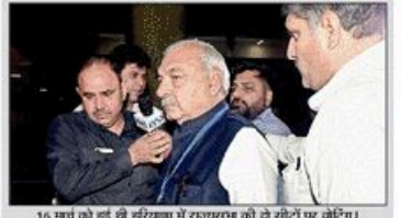
16 मंत्रियों को बुलाते हैं हरियाणा में राज्यसभा को दो दिनों के बाद

राज्यसभा चुनाव के दौरान क्रॉस वोटिंग के आरोप झेल रहे कांग्रेस के विधायकों को विधानसभा का फैसला अब दिल्ली 'दरबार' में होगा। प्रमुख विधायकों को अनुशासन समिति की रिपोर्ट के आधार पर दो दिनों के बाद पार्टी की अनुशासन समिति के अध्यक्ष जे.पी. अरोड़ा ने दिल्ली में एक बैठक में कांग्रेस के 16 विधायकों को बुलाया।