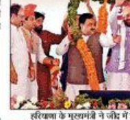
हरियाणा के मुख्यमंत्री ने जौनपुर में किसान रेली को संबोधित किया।