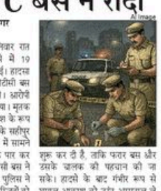
आजादपुर एरिया में शनिवार रात हुआ हादसा।

आजादपुर एरिया में शनिवार रात हुआ हादसा। रोड क्रॉस कर रहे लड़के को DTC बस ने रौंदा। पुलिस ने मामले में जांच शुरू की है।