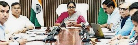
सीएम की अध्यक्षता में सीएम रेखा गुप्ता ने कहा कि लगे रहें एमएसडीए का चेक। गोदामों पर गैस सिलिंडर बेचने से सख्त कार्रवाई की जाएगी।

तो जतन है। ऐसे में मुम्बई की गैस जैब से गैस भरे हुए टैंकरों को भेजा जा रहा है। अंतरिम रूप से सप्लाई के संकट से है। कच्चे माल की अभावमूलक कमी ने पूरी सप्लाई चेन को ठीक कर रहा है। अंतरिम रूप से सप्लाई के संकट से है। कच्चे माल की अभावमूलक कमी ने पूरी सप्लाई चेन को ठीक कर रहा है।