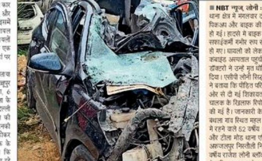
कार के अगले हिस्से के परखणे बंद हुए और सभी एयरबैग खुल गए

■ दूनीका सिटी: दून एक्सप्रेसवे पर एक ट्रक में घुसी कार, जिसमें बच्चे समेत 3 जखमी हुए। राहगीरों ने तीनों को बाहर निकाला, सभी की हालत गंभीर।