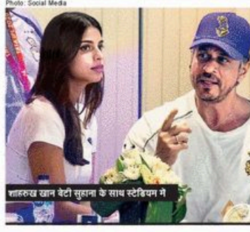
शाहरुख खान बेटी सुलाना के साथ स्ट्रेचिंग में

आलिया के लिए भी अहम है यह ब्रेक आलिया को बात करे तो उनके लिए भी यह ब्रेक काफी अहमियत रखक है क्योंकि जाने बाले किने में यह काफी बिजी होने वाली है। बीते किने फैस से एक बातचीत में आलिया ने खुद स्वीकारा था कि आने बाला मई उनके लिए काफी बिजी रहेगा। पर असल उम्मेदने यह जवाब मेट गलाया या Cannes में उनकी मौजूदगी बाले सवाल पर दिया था। गौरतलब है कि इस साल मेट गलाया और Cannes फिल्म फेस्टिवल, दोनों मई के महीने में होंगे। आलिया के इस जवाब के बाद उनके फैस यह उम्मेद लगा रहे है कि उनकी कैरिअर एक्ट्रेस इन इन्टरनेशनल इवेंट्स पर मौजूद होंगी।