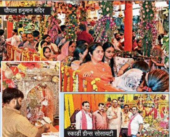
चोपला हनुमान मंदिर

■ NBT न्यूज़, गाजियाबाद हनुमान जयंती गाजियाबाद में विशेष पूजा-अर्चना की गई और पूजा-उत्सव मंडिरों में हनुमान जी की विभिन्न पूजा-अर्चना की गई। रात 12 बजे को सप्ते अधिक भक्तों के साथ हनुमान जी का पूजन किया गया। सप्ते पहले मंदिर के पीठाधीश्वर श्रीमान श्रीमान श्रीमान ने पूजा-अर्चना की। उसके बाद मंदिर के कर्तव्य बंधुओं के लिए पूजा-अर्चना की गई। मंदिर के पीठाधीश्वर श्रीमान श्रीमान ने पूजा-अर्चना की। उसके बाद मंदिर के कर्तव्य बंधुओं के लिए पूजा-अर्चना की गई।