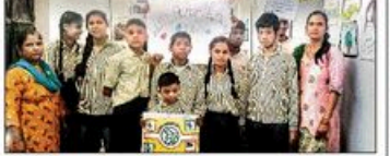
बच्चों ने रंगारंग कार्यक्रम किए प्रस्तुत

16 अप्रैल 2025 को संसद हुए मीटिंग में अंतर्गत जल निकायों के अंतर्गत आभा ईआईडी को बढ़ावा दिया जायेगा। एलास्टिक 9 दिवसीय श्री राम कथा के सातम दिन मंडिर और अस्था का अदुत सारम देहने के मिला। इस आसार पर कथा काव्य करीब 10 दिवसीय सनीयस राम कथा समाज में धर्मिक वास्तविक और सारकृतिक मूवों को बढ़ावा देने के उदेश्य से आयोजित की जा रही है।