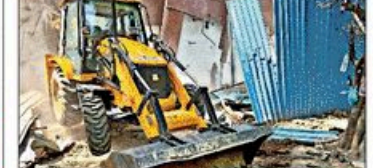
GDA की टीम ने विरोध के बीच अवैध निर्माण ढहाया