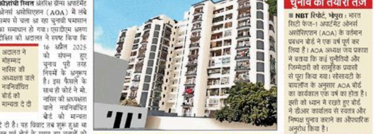
कोर्ट ने 16 अप्रैल 2025 के चुनाव को माना वैध

16 अप्रैल 2025 को संसद हुए मीटिंग में अंतर्गत जल निकायों के अंतर्गत आभा ईआईडी को बढ़ावा दिया जायेगा। एलास्टिक 9 दिवसीय श्री राम कथा के सातम दिन मंडिर और अस्था का अदुत सारम देहने के मिला। इस आसार पर कथा काव्य करीब 10 दिवसीय सनीयस राम कथा समाज में धर्मिक वास्तविक और सारकृतिक मूवों को बढ़ावा देने के उदेश्य से आयोजित की जा रही है।