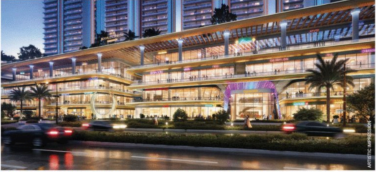
ARTISTIC IMPRESSION *T&C APPLY