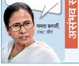
ममता बनर्जी, TMC कैब

सब कुछ बदल दिया गया है, यहां नया सेटअप है। नूनान आयोज द्वारा नियुक्त नए अधिकारी आपके नामांकन खारिज करने के लिए लगार गए हैं, इसलिए नॉमिनेशन फ़ाइल करते समय सतर्क रहे।