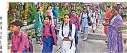
■ स्कूलों में फूलों से स्वागत किया गया।

■ नई दिल्ली : राजधानी दिल्ली में 1 अगस्त से नए अध्यापक भर्ती 2024-25 की शुरुआत हुई। स्कूलों में फूलों से स्वागत किया गया। ■ नई दिल्ली : राजधानी दिल्ली में 1 अगस्त से नए अध्यापक भर्ती 2024-25 की शुरुआत हुई। स्कूलों में फूलों से स्वागत किया गया।