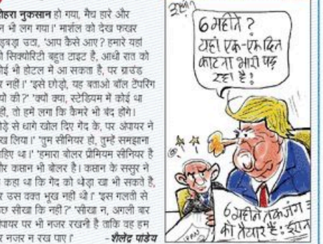
जन्ता जंक्शन इरफ़ान