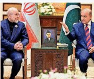
उम्मीदें जगी... ईरानी संसद के स्पीकर मोहम्मद बाकिर मोहम्मद से पाक के पीएम इमरान खाना के अलावा बात की।

अमेरिका की तरफ से जेडी खाना (उपराष्ट्रपति) स्टीव विडवॉक (रक्षा दूत) जेरेड कुशनर (ट्रंप के दाम्पत्य) ब्रेड कुपर (सैन्य अधिकारी)