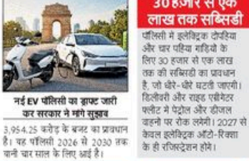
नई EV पॉलिसी पर ड्राफ्ट जारी कर सरकार ने मंगे सुझाव 3,954.25 करोड़ के बजट का प्रावधान है। यह पॉलिसी 2026 से 2030 तक जारी कर साल के लिए आई है।

नई दिल्ली: पेट्रोल से चलने वाली ट्रेडिक गाड़ियों को धीरे-धीरे दिल्ली की सड़कों से हटाने की तैयारी है। इसके लिए सरकार नई ई-वीकल (EV) पॉलिसी लेकर आई है। शनिवार को इसका मसौदा पब्लिक कर दिया गया। 10 मई तक लोगों से सुझाव मांगा गया है। पॉलिसी के मुताबिक, दिल्ली में अप्रैल 2028 से ट्रेडिक ट्रेडिक ट्रेडिक चलने का रजिस्ट्रेशन होगा। EV खरीदने पर रोड टैक्स और रजिस्ट्रेशन में 100 फीसदी की छूट मिलेगी। इसके लिए