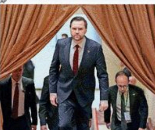
बैठक जारी... इस्लामाबाद में पाकिस्तान के पीएम से ईरान के मुई पर बात करने जाते हुए अमेरिकी उपराष्ट्रपति जेडी खाना।

47 साल पहले जून 1979 में ईरान की इस्लामिक क्रांति के बाद ने पहली बार है, जब दोनों देश के नेताओं ने इतने बड़े पैमाने पर आमने-सामने बैठकर बातचीत की है। बातचीत बंद बयानों में हुई, जिससे जानकारीपूर्ण संदेश जारी पर देर रात तक सामने आई आई, लेकिन दोनों पक्षों के हितों के बाद की मुलाकात से आगे और प्रति को उम्मीद नहीं है।