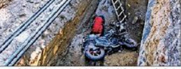
जनकपुरी में DJB के एक खुले गड्ढे में निरने से गढ़ी वी कमल ध्यानी की जमानत

NBT न्यूज, जनकपुरी नई दिल्ली पुलिस ने अखिबर 7 अखिल को कोर्ट में जमानत दाखिल कर दी।