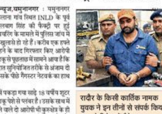
शूटर ने 50 हजार के लिए प्लंबर बना शूटर पर फायरिंग की।