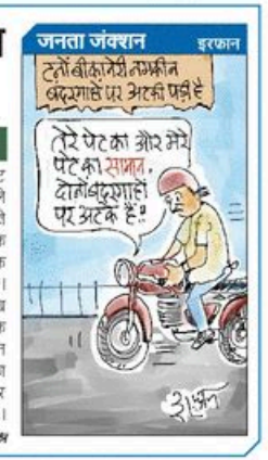
प्रस्तुति : सुभाष चंद शर्मा

आपने एक पेड़ लगा दिया, तो समझिए कि अक्षय फलव डालें। कल गूब है कि शांति फलव अतुराधुप। आने एक पेड़ लगाया, समझे आपने परमात्मा डालें।