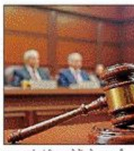
गंभीर कमियां DCP को विरुद्ध रिपोर्ट देने का आदेश, 13 अप्रैल को उगलते सुनवाई कोर्ट ने जांच में गंभीर त्रुटि पाई, निरसरी अग्रिमोक्षण पक्ष का मामला कगजोर से गया

NBT दिल्ली: रेप केस में गंभीरता से जांच में खामियों को लेकर अदालत ने दिल्ली पुलिस पर कड़ी टिप्पणी की है।