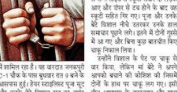
ने शामिल रहा है। यह बरदात जनकपुरी C-1 चौक के पास बुधवार रात 9 बजे के आसपास हुई।

नवीन निपटार, जनकपुरी रोड रेज में मां बेटे पर चाकू से हमला करने का मामला सामने आया है।