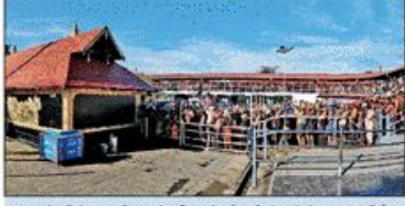
9 जजों की बेंच सबरीमला में महिलाओं की एंट्री से जुड़े केस सुन रही है।

■ नई दिल्ली: सबरीमला केस में सुप्रीम कोर्ट ने गुरुवार को कहा कि हर जगह की सभी महिलाओं और बच्चों को मंदिर में एंट्री देनी चाहिए। किसी एक वर्ग के नाम पर दूसरी को जगह से रोकना, जो सार्वजनिक आरंभ स्थल पर प्रवेश और समाज में विभाजन ब्रिंगे। कोर्ट ने सबरीमला मंदिर में विशेष अनुमति को खत्म करने के प्रस्ताव पर रोक का समर्थन किया। बहर, 2018 का फैसला इस धारणा पर आधारित था कि पुरुष श्रेष्ठ है। सॉलिसिटर जनरल तुषार मेहत ने कहा, यह पुरुष-केन्द्रित महिला-केन्द्रित धार्मिक मान्यताओं का उल्लंघन नहीं है। सौभाग्यवश महिलाओं को प्रवेश देने का, श्री केन्द्रस्थाना देवरेड बसम कौन वचन मामले में सुप्रीम कोर्ट का फैसला किया था। उस फैसले में कोर्ट ने मना था कि सार्वजनिक प्रकृति के मंदिरों में सभी वर्गों के हिंदुओं को प्रवेश मिलना चाहिए, नतीजे ही मंदिर किस्में विशेष संरक्षण से मुक्त हों।