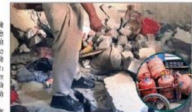
गुजरात की सुबह करीब 8 बजे यह हादसा हुआ, जब घर के अंदर बड़े सिलिंडर से छोटे सिलिंडर में गैस भर जा रही थी।

यमुनानगर में गुजरात की एक एलपी गैस सिलिंडर फटने से सात बच्चों और दो महिलाओं समेत 11 लोग गंभीर रूप से घायल हो गए। सात बच्चों का शरीर 50 से 60 प्रतिशत जलून तक पहुंच गया। एक गर्भवती भी झुलसी है, जिसकी हालत नाजुक है।