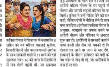
घौरी में मां-बेटी गिरफ्तार किए गए।

करनाल जिले के गांव घौरी में एक महिला को मां-बेटी गिरफ्तार किया गया।