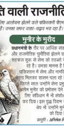
प्रस्तुति : अमिकेश मिश

जनाता जंक्शन इरफान टट्टों बीबीसी टट्टीनी बरगमाई पर आरती पढ़ते हैं। टट्टे पेट का और मेरे पेट का सप्ता, टट्टे पेट का और मेरे पेट का सप्ता, टट्टे पेट का और मेरे पेट का सप्ता।