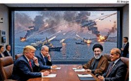
अमेरिकी दबाव के चुनौती लगातार धमकीयों के बाद भी तेहरान डटा रहा। ईरान की ताकत और जवाब देने की क्षमता कायम। नेटो से मनुष्यत्व, US की साह को लगा बखला।

होर्मुज का संघ । इस संयम में होर्मुज एक बड़ा मुद्दा रहा, पर हकीकत यह है कि यह गहरा तै कभी पूरी तरह नहीं है। ईरान ने केवल अफ्रीका-इराहल और उनके सहयोगियों के जहाजों की आवाजाही पर पकड़ी लगाई थी। अब इस के खुलने को बहुत बड़ी उपलब्धि के तौर पर पेश किया जा रहा है, जो महंगे सैन्य अधिमान के बाद मिली है।