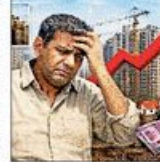
गुरुग्राम में 5575 रुपये प्रति वर्ग फुट

हरियाणा सरकार ने अक्टूबर तक हाउसिंग वॉलेज में वृद्धि करवाने का फैसला किया है।