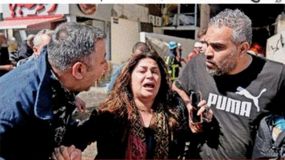
युद्धविराम के कुछ घंटों के अंदर ही इस्त्राइल ने लेबनान के शहरी पर हवाई हमले किए।

■ एपी, पाकिस्तान/तेहरान: इस बात पर चर्चा के साथ सोर में कोई अहम लेन-देन के कोई बत-बत न्यून अपडेट देखाकर, लेकिन सुबह हुई ले उम्मीद की किरा भी नगर आ गई। मारना को मिला देने वाली धमकी में विश्वास आगे बढ़ गया और युद्ध की असमंजस पर विचार लगने पर स्थिति बन गई, शुरूआत मिले तो दो हफ्ते के बीच में हुई है। ■ पश्चिम एशिया में 28 फरवरी से शुरू हुई जंग में 3700 से ज्यादा मौतों के बाद 400 दिन चलत की खबर आई। अमेरिका और ईरान दो हफ्ते के सीजफायर पर सहमत हो गईं। पाकिस्तान की मध्यस्थता और अखंडी समय में चीन के दखल के बाद यह संभव हो पाया। होर्मुज समुद्री मार्गवर खोलने और ईरान के लिए ईरान पर टुंग की डेडलाइन लाइविय समय के मुताबिक सुबह 5:30 बने समय हो रही थी। इसमें तीन 10 मिनट पहले तो पाकिस्तान के प्रधानमंत्री रहस्यमय शक्ति ने फैशन किया कि सीजफायर शुरू कर दिया गया है। फिर टुंग ने फैशन किया कि शरबाज शरीफ और फेरिड मारल आदिम में बत-बत के बाद अमेरिका सीजफायर को रानी हुआ है। ईरान ने भी मंजूरी देते हुए कहा कि हमारी शर्तें मान ली गई हैं। पाकिस्तान ने जिमा सीजफायर का ऐलान किया, उसमें लेबनान में भी हमारे लेकने थे, लेकिन इस्त्राइल ने जहां हमारे जवाब दिये। इससे माराज ईरान ने होर्मुज को फिर बंद कर दिया और कहा कि हमने होने की ले सीजफायर तोड़ दी। ▶ पेज 5