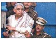
11 कैसों में बरी, 2014 से लगातार हिरासत में

NBT न्यूज, चंडीगढ़ पंजाब-हरियाणा हाईकोर्ट ने सहायक आराम के संसदक रामपाल को जमानत दे दी।