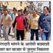
पुलिस ने रंगदारी मांगने के आरोपी बदमाशों को गिरफ्तार कर बाजार में जुलूस निकाला

NBT न्यूज, जींद रंगदारी मांगने के आरोपी बदमाशों की पुलिस ने बुधवार को गिरफ्तार कर लिया।