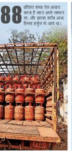
कच्चा तेल के अभाव के कारण सिलिंडर की सप्लाई में बाधा पड़ रही है।

88 प्रतिशत कच्चा तेल अभाव कर रहा है भारत अपने उत्पन्न तेल, और इसका बर्तन अभाव हिस्सा हमुम है अभाव था। 88 प्रतिशत कच्चा तेल अभाव कर रहा है भारत अपने उत्पन्न तेल, और इसका बर्तन अभाव हिस्सा हमुम है अभाव था। संघर्ष विराम की घोषणा के बीच सिलिंडर की सप्लाई की उम्मीद बढ़ी है। हालांकि, कच्चे तेल के मामले में आधुनिक जलद बहाव हो सकती है, जबी LNG और LPG के मामले में बहुत जल्द सुधार होने की संभावना नहीं है। संघर्ष विराम की घोषणा से ऐन पहले तक हमुम रिटेंट के उस पर 16 करोड़ डॉलर था। इनमें केवल एक पर LPG, एक पर LNG है और पांच पर कुछ है। LPG वाले जलद पर करीब 22000 टन LPG होने का अनुमान है। हालांकि, इंडियन की इजलास से हमुम पर करने की इजलास मिशन के भी इन जलदों को बाल खूदने में चार से पांच दिन लगा सकते हैं। मोहन विल टाइम डेटा प्रोबेडर Kpler के संविनर रिमर एनालिसिस निडिज टुडे ने NBT से कहा, 'अभी कुछ और रिमरिड प्रोबेडर से लड़े कई टैकर फास की खपती में फसे हुए हैं। इमने प्रोबेडर 13.2 करोड़ बैरल कच्चा तेल और रिमरिड प्रोबेडर है।' टुडे ने कहा, '14 दिन के संघर्ष विराम की आधापि उस फसे हुए बाल को किलवर करने के लिडान से अडम है।' यह किडने नेडे से होत, यह संघर्ष विराम की डर के पलन पर पर निर है। भारत अपने जलद का 85% कच्चा तेल अभाव करता है और शेष करीब आधा हिस्सा हमुम से आता है। इमने हमने ने खपती के टैरे के अडिफ पोलन को नुकसान हुआ है और कुछ कुडों को निचरत रुक जाने के कारण बंद करन पड। इनको टैकरा पालू करने में 2-3 हफ्ते लगा सकते हैं। फिर भी पूरि करन करीब 41 टैरे से कुछ टैरे