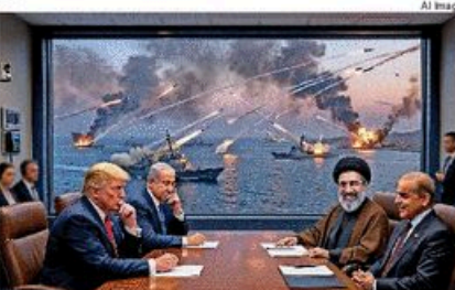
अमेरिकी दबाव को चुनौती | लगातार धमकियों के बाद भी तैहान डटा रहा | ईरान की ताकत और जवाब देने की क्षमता कायम | नेटो से समुद्रपुत्र, US की सख को लना दखल

अमेरिकी राष्ट्रपति डॉनल्ड ट्रंप ने जब धमकी दी कि अब उन एक पुरी सम्यक खत्म हो जाएंगे, तो पुरी दुनिया हिल गई। अगर यह धमकी सच में पूरी होती, तो ट्रंप का नाम इतिहास में 13वीं सदी के मंगोल शासक ओंगेडेई खान के साथ लिखा जात। ओंगेडेई के हमलों ने पुरी पुरी सम्यक को मित देने के कधार पर लड़ दिया था।