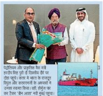
पेट्रोकेमिकल और प्राइमरी गैस नई हरदोय सिडपुरी टो इन्डिया टैंकर पर देखा जा रहा है। कलर में भरने के राजदूत भिजल और कलरप्लांटों के अक्सरों में उनका स्वामता किया। वही, हेमंत पर कर टैकर 'बैन अवर' नहीं मुर्दाहमले पर।

■ NBT विशेष, नई दिल्ली: मेरठ में शरीफ निवासी पर मुर्दाहमले के मुकदमे को लेकर नया मुकदमा खोलने के आदेश दिए। साथ ही अधिकारियों को निर्देश दिए कि वे केस के अंतिम इमर्जेन्सी के चारों ओर निरीक्षण अधिकारियों को सूचना देकर ही मुकदमा खोलें।