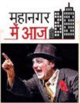
महानगर में आज

शहरकद फैलाव। रवेरा नगर। शहमी नगर। लाजपत नगर। जहाजीपुरी। बसंत कुंज। कबीरवाड़ा। परिवहन विहार। कौडी नगर। लखनऊली एक्सप्रेसवे। महरौली। भाकपुरी। रजिंदर नगर। राजेंद्र नगर। फारुखनगर। नारायणा। मौजपुर। मियावली। कालकाजी। नानाल रावा। सरिता विहार। श्रैल विहार। वसंत विहार।