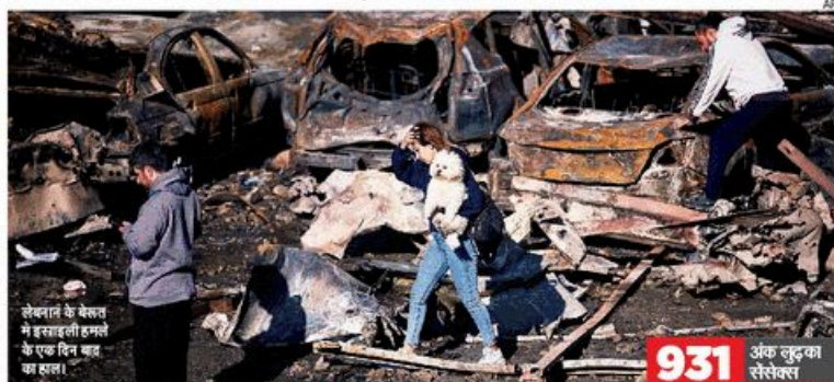
लेबनान के बेकल में इस्राइली हमले के एक दिन बाद का दृश्य।

डॉन यान्ने डॉनल्ड ट्रंप के विषय में क्या चल रहा है, यह कोई नया जलवा है। सभ्यता मिटा डालने की धमकी के बाद उन्होंने सीरियावर को समर्थन दे दी। लेकिन उसके बाद इस्राइल ने लेबनान में सखी मारा था। ईरान और पाकिस्तान कह रहे हैं कि युद्धविराम की शर्तों में जो लेबनान पर हमला नहीं करने की बात थी लेकिन ट्रंप इससे साफ इनकार कर रहे हैं। उनका कहना है कि मेरी सेना तैयार है, पहले से ज्यादा धाकड़ बाइबल के साथ और अगर नतीजा ईरान को उस पर और ज्यादा धाकड़ लगने पर देना। इस्लामवाद में खल से खलवात की तैयारी से रहे है जिसकी बुनियाद अविश्वास पर बनी है।