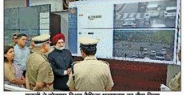
एनबीटी ने टोटापुर सिविल ट्रैफिक पुलिसकर्मियों का दौरा किया

अपनी तक अब लहंगे में लोकल मार्ग में तैनात महिला पुलिसकर्मियों को ही एनबीटी ने पूरे देश में, लेकिन अब ट्रैफिक पुलिस में तैनात महिला पुलिसकर्मियों की कुट्टी में नगर नगर आग्री है। दिल्ली के उपत्यका इलाकों में तैनात महिला ट्रैफिक पुलिसकर्मियों की कुट्टी में नगर नगर आग्री है। दिल्ली के उपत्यका इलाकों में तैनात महिला ट्रैफिक पुलिसकर्मियों की कुट्टी में नगर नगर आग्री है।