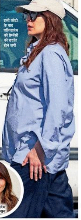
इसी कैटो के बाद एलिजाबेथ की प्रेगनेंसी की चर्चाएं तेज लगीं

हाल ही दिनों में जॉना डॉर्न स्कारलेट विच के रोल से मशहूर एलिजाबेथ ओल्सन की प्रेगनेंसी की चर्चाएं इन दिनों तेज हैं। दरअसल वे अटकलें तब शुरू हुईं, जब एलिजाबेथ हाल ही में अपने पति रॉबिं अश्टेन के साथ नजर आईं। इनकी खबर तस्वीरों में एलिजाबेथ सॉफ़्ट एंजिलस की सड़की पर एक बड़ी नीले रंग, डोले-डोले पैट और कैप परने हुए नजर आ रही हैं। एलिजाबेथ के लुक को देखकर ऐसा लग रहा है कि वह अपने बच्चे की तैयारी कर रही हैं। हालांकि, अभी एलिजाबेथ और उनके पति अश्टेन ने अभी तक इन अटकलों पर सावधानीक रूप से कुछ नहीं कहा है। लेकिन फैसल यह मान कर चल रहे हैं कि कपल अपने पहले बच्चे की तैयारी कर रहा है।