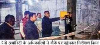
सेक्टर-150 पर हादसे वाली जगह अब भी पहुंच रहे लोग

सेक्टर-150 के अजनारा होम्स सोसायटी के बेसमेंट में सीवर का पानी भरने के मामले में ग्रेटर नोएडा अग्निशक्ति ने बिलदार पर 50 लाख रुपये का जुर्माना लगाया है। सोसायटी का एजेंसी भी दो साल से बंद पड़ा है। जहा अग्निशक्ति सीवर को जले में बहाया जा रहा है। जहां, बृज निवारण न करने पर यह तक लख रुपये की फनालटी लखाई गई है। सोसायटी में नगरकल की निम्मेदारी संभाल रही एजेंसी के विपक्ष केस दर्ज करने के लिए पुलिस को प्रस लिख गया है।