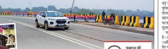
सेक्टर-150 पर हादसे वाली जगह अब भी पहुंच रहे लोग