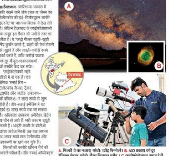
A. निचले वे का पन्धरा। B. 650 प्रकार का नई डिस्कवरी नेचुर। C. एस्ट्रोफोटोग्राफ सुगम रहे

रोशनी और सेटलाइट से जंग प्राइमर अक्षर सफा नहीं देता। हैडलाइट जैसे राक्षस में डॉक्टर रक्ते पर करीब 9 लाख से ज्यादा पन्धरा पर आता है, इनमें से करीब 10 लाख हैं। इनसे बचने के लिए मरीज फिल्टर (एक लाख रुपये का) लेने पड़े हैं या सेकंडरी डिफ्लेक्टर 'रू' जैके रूकबा काली जगहों पर जान पड़ता है। मेरी नजर एक खानदार लखीर पर पड़ी। मुझे लगा यह कलक टेलेस्कोप से ली गई है, लेकिन पता चला कि रूकबा में इसे फीट से मिलक किया। यही से एस्ट्रोफोटो जगुन बन गई। -सुरेश कुमार एस्ट्रोफोटो शुरू करने वाली को रस्ता है कि दूरबीन, फोन का बैकैस DSLR से शुरू करें और मेकनार है। AI वे टेलीस्कोप की तरकीबों से उम्मीद करना निराला होता है। -सौरभ किशोर हुतन