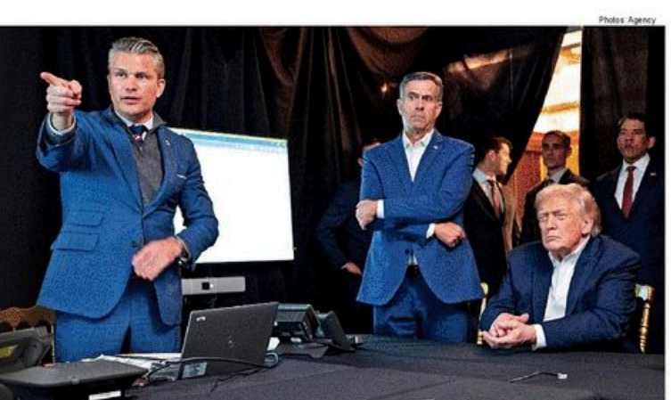
ट्रंप ने कहा, मैंने पूरे ऑपरेशन को टॉपीचो की तरह देखा।

यह कार्रवाई अचानक नहीं हुई। CNN की रिपोर्ट के मुताबिक, इसका मकसद शुरू से साफ था- माद्रो को वेनेजुएला की सत्ता से हटाना। हालांकि, पहले सांख्यिक रूप से कहा जाता रहा कि अमेरिका का इरादा वेनेजुएला में सत्ता बदलने का नहीं है, लेकिन ट्रंप के पीछे वैश्वी बल रही है। ट्रंप को डर था कि वही अमेरिका विश्वी लक्ष्य है न फल जाए, लेकिन क्लिपसस से पहले उन्होंने ऑपरेशन को हरी झंडी दे दी।